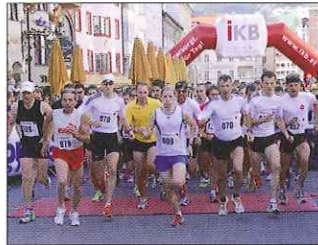
Fast 1.000 Teilnehmer sorgten beim Tiroler Firmenlauf für einen neuen Teilnehmerrekord

Fast 1.000 Teilnehmer machten den Firmenlauf in der Innsbrucker Innenstadt zur sportlichsten Betriebsversammlung des Landes. Mit dabei war auch ein rund 30-